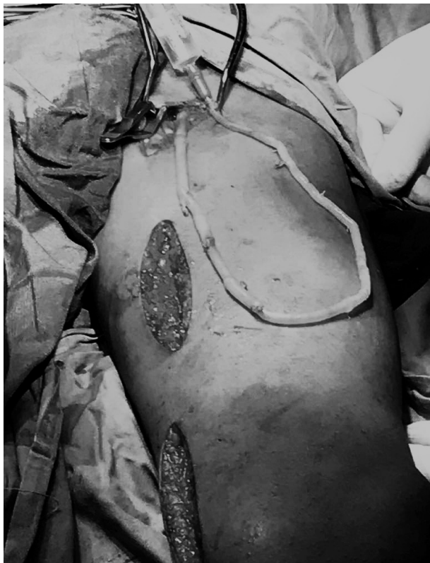
Imagen 1. Loop Safeno-femoral izquierda