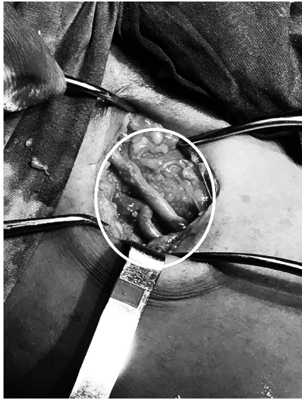
Imagen 2. Anastomosis proximal a la AFS