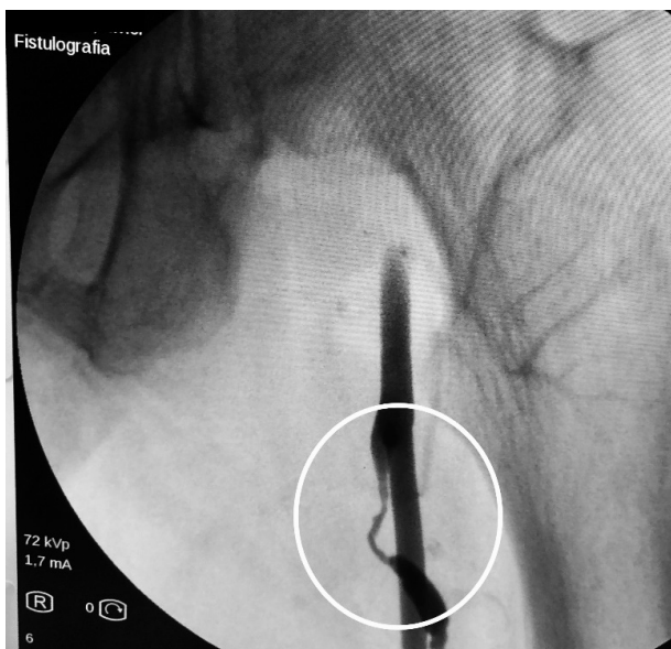
Imagen 3. Estenosis postanastomótica con compromiso de la rama arterial de la FAV