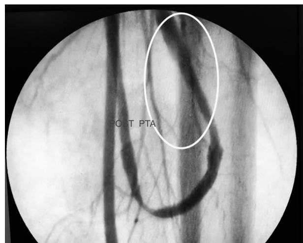
Imagen 6. Control angiográfico

Conflicto de intereses: Los autores declaran no poseer ningún interés comercial o asociativo que presente un conflicto de intereses con el trabajo presentado.