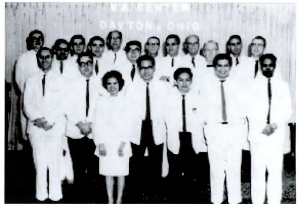
Residencia Dayton – Ohio - 1965