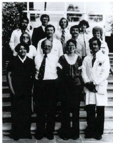
Hospital veteranos de Vietnam