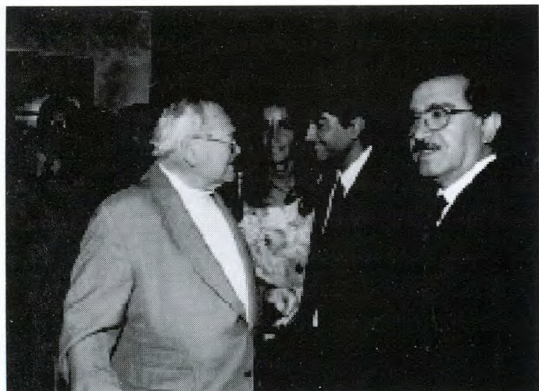
Inauguración de la Fundación con el Dr. Robert Cade